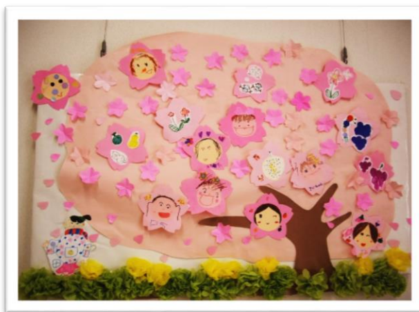
《季節の壁面製作*4月 桜満開》